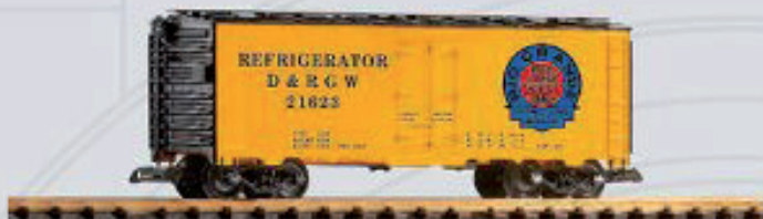
38826 Güterwagen D&RGW