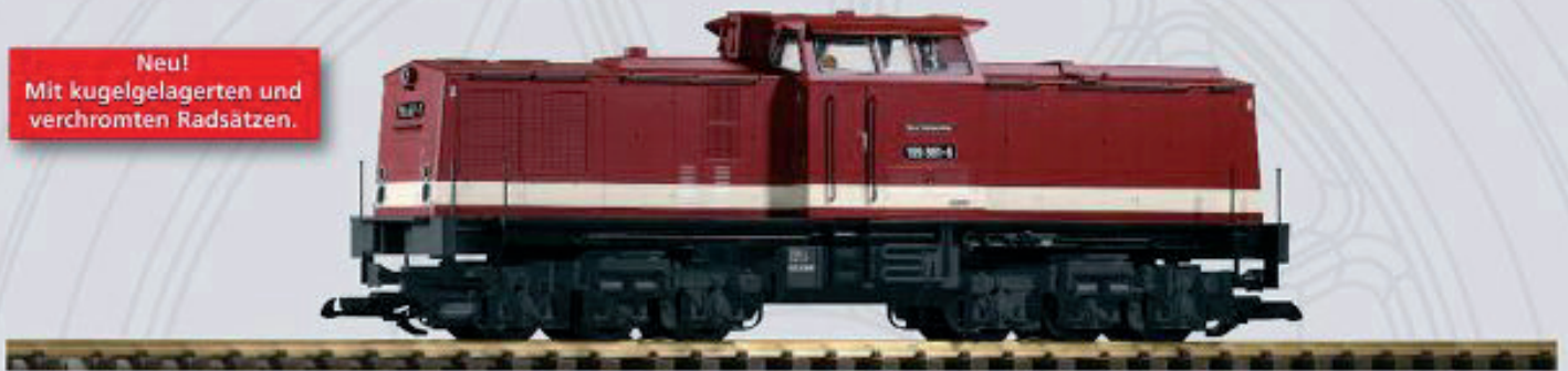
37541 Schmalspur-Diesellok BR 199 „Harzer Schmalspurbahnen“ Ep. V

Neu! Mit kugelgelagerten und verchromten Radsätzen.