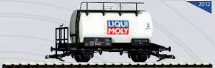
37916 Kesselwagen „LIQUI MOLY“ DB Ep. IV 74,99 €*

Neu! Mit kugelgelagerten und verchromten Radsätzen.