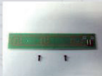
36133 Innenbeleuchtung für Motorwagen VT 11.5 29,99 €*