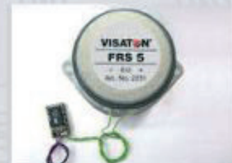
36199 Sound-Modul & Lautsprecher VT 11.5 184,99 €*