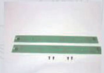
36134 Innenbeleuchtung für Zwischenwagen VT 11.5 39,99 €*