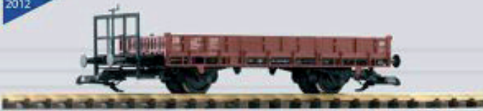
37904 Niederbordwagen DR Ep. III 59,99 €*