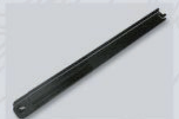
36039 Handentkuppler zum einfachen Entkuppeln von Gartenbahn-Fahrzeugen 4,00 €*