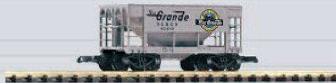
38824 Schüttgutwagen D&RGW 44,99 €*