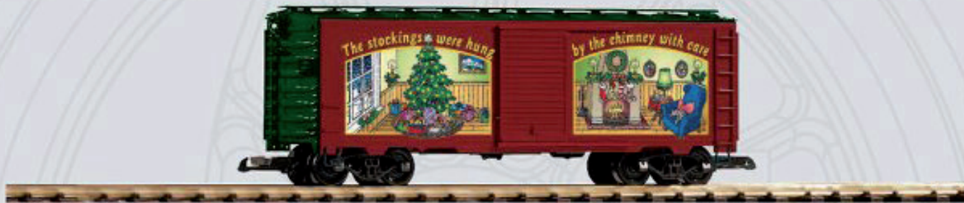
38822 Weihnachtswagen 2012