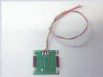
35267 Reedkontaktschalter zum Auslösen der Glocke und Pfeife des Sound-Moduls #36194 durch den Schaltmagneten #35268 9,99 €*