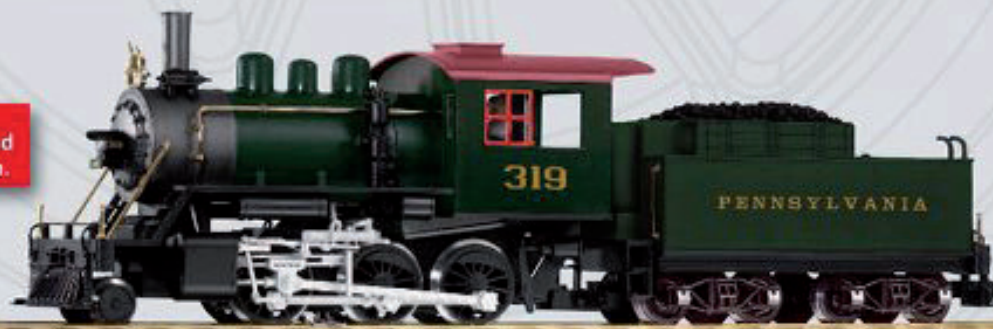
38213 Dampflokomotive, Tender mit Bretterauflauf „Mogul“ PRR Die Lok ist bereits mit Sound- und Dampffunktion ausgerüstet.

Neu! Mit kugelgelagerten und verchromten Radsätzen.