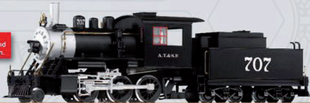
38212 Dampflokomotive mit Öltender „Mogul“ Santa Fe Die Lok ist bereits mit Sound- und Dampffunktion ausgerüstet.

Neu! Mit kugelgelagerten und verchromten Radsätzen.