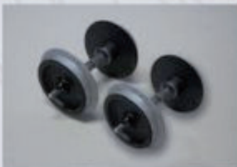
36164 Radsatz 2 St., ø 30 mm verchromt 19,99 €* 36165 Radsatz 2 St., ø 35 mm verchromt 19,99 €*