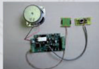
36194 Analog-Sound BR 80 Modul zum Nachrüsten der BR 80. Mit dem Reedkontaktschalter #35267 können Glocken- und Pfeifensound durch den Schaltmagneten #35268 ausgelöst werden. 69,99 €*