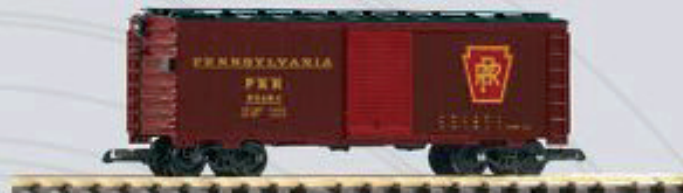
38825 Güterwagen PRR